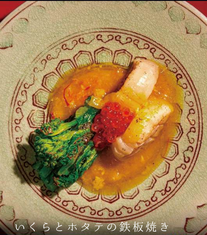
いくらとホタテの鉄板焼き