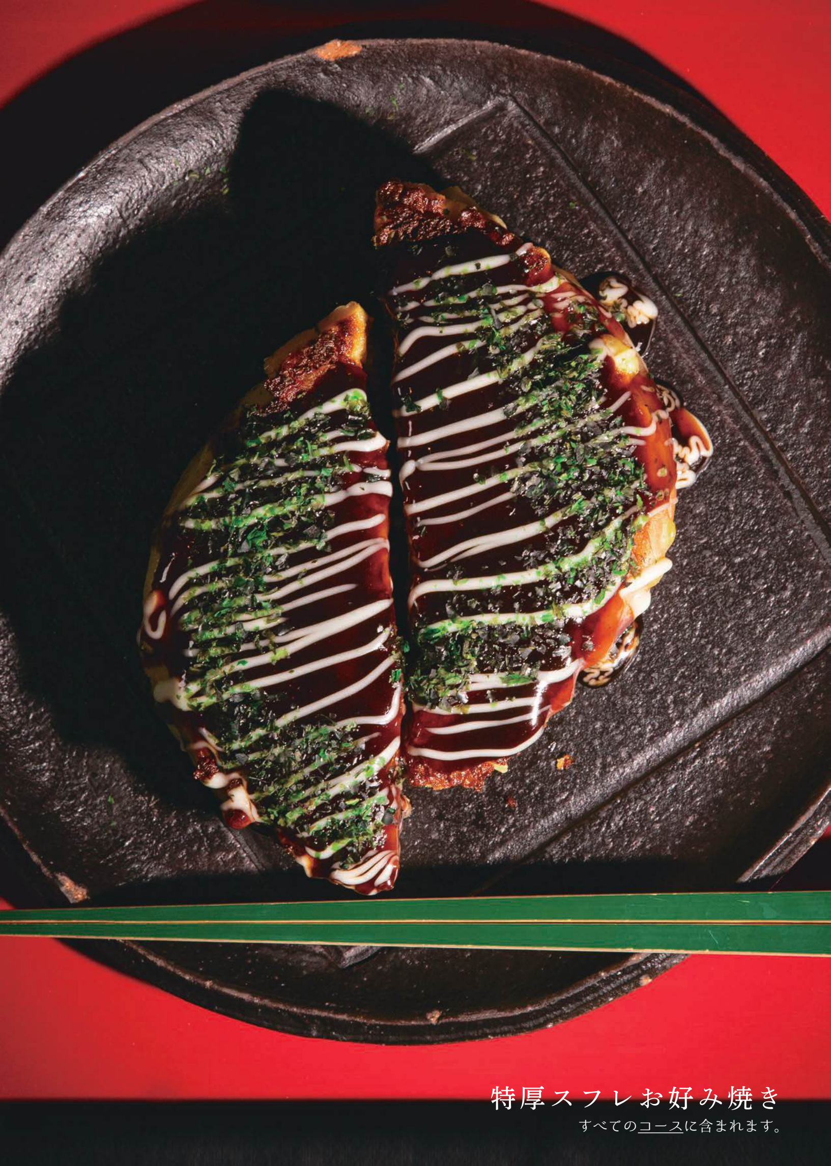
特厚スフレお好み焼き すべての コース に含まれます。